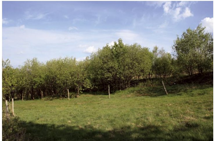
Abb. 7 Lebensraum von Hydriomena ruberata mit Salweidenbeständen auf ehemaliger Haldenfläche: Zinnwald (Ortslage) im Osterzgebirge, 06.05.2007.