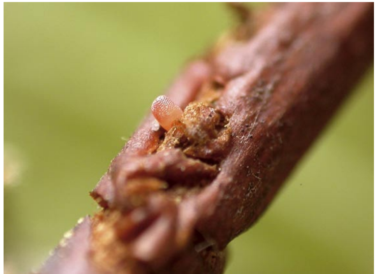
Abb. 8 Eiablage von Hydriomena ruberata in den Spalten eines Ohrweidenzweiges. Daten: Thüringen, Lobenstein, Gemäßgrund, 690 m NN, Weibchen: 19.05.2006.