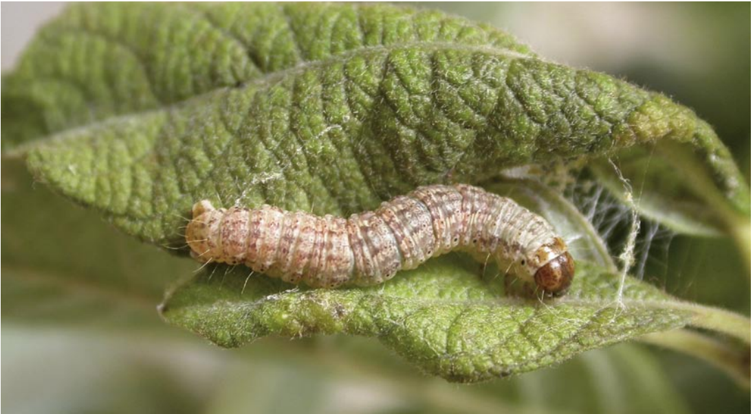
Abb. 10 Dorsalansicht einer erwachsenen Raupe von Hydriomena ruberata . Daten: Thüringen, Lobenstein, Gemäßgrund, 690 m NN, Weibchen: 19.05.2006.