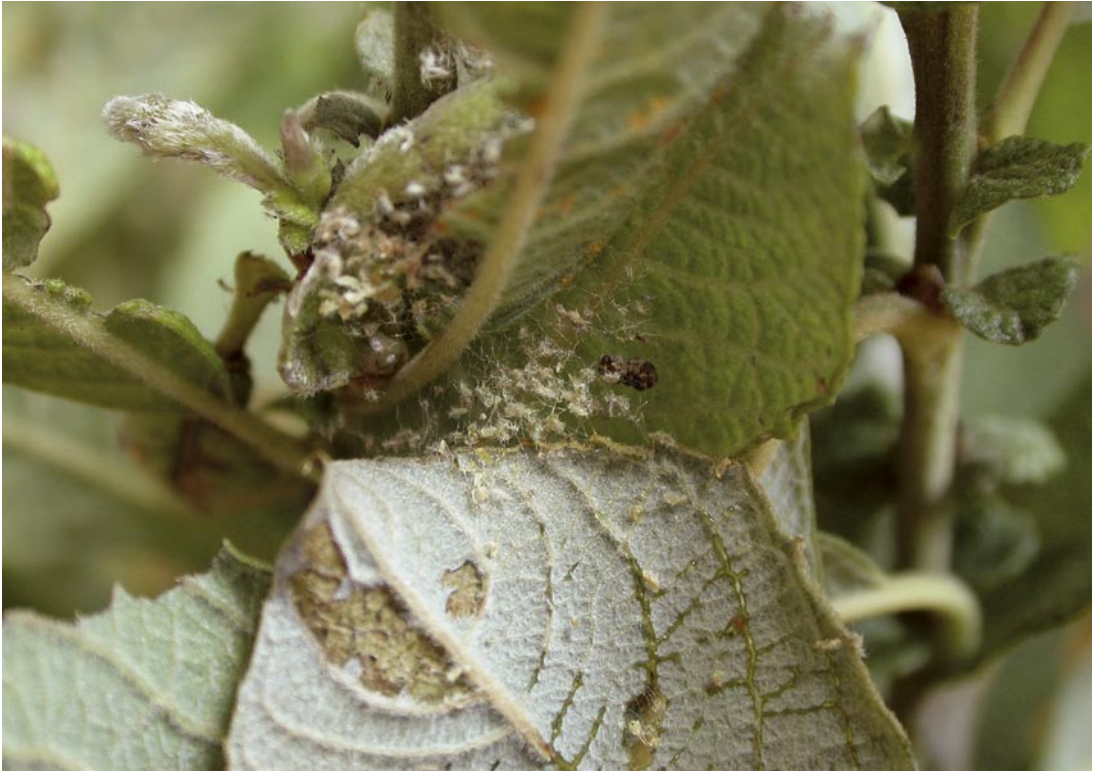
Abb. 9 Typisches Fraßbild einer erwachsenen Raupe von Hydriomena ruberata an Salix aurita . Daten: Thüringen, Lobenstein, Gemäßgrund, 690 m NN, Weibchen: 19.05.2006.