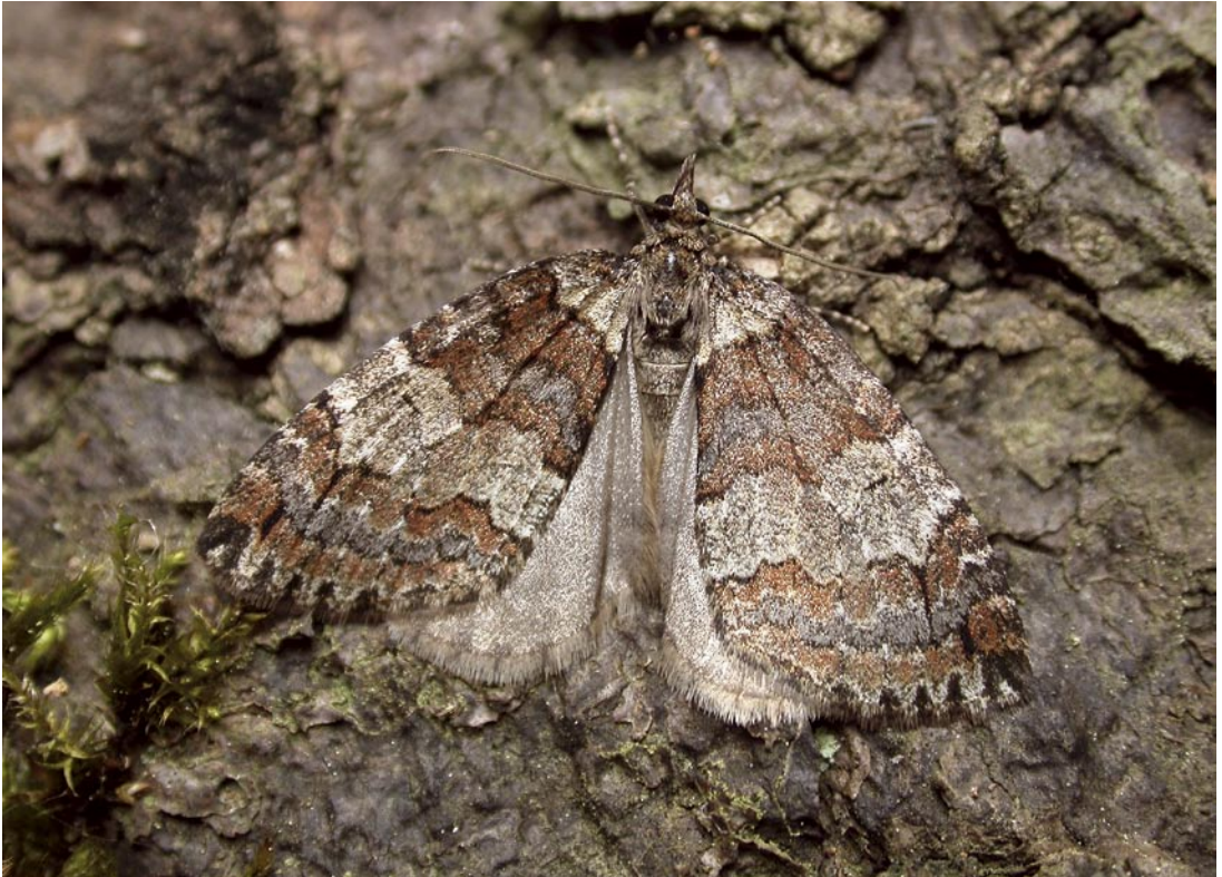
Abb. 1 Männchen von Hydriomena ruberata . Daten: Thüringen, Lobenstein, Gemäßgrund, 690 m NN, 17.05.2006.