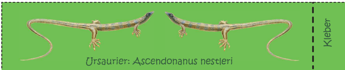
Ursaurier: Ascendonanus nestleri